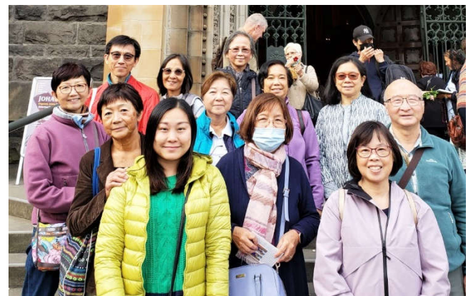
3月26日與聖母同行 March 26 Walk with Mary